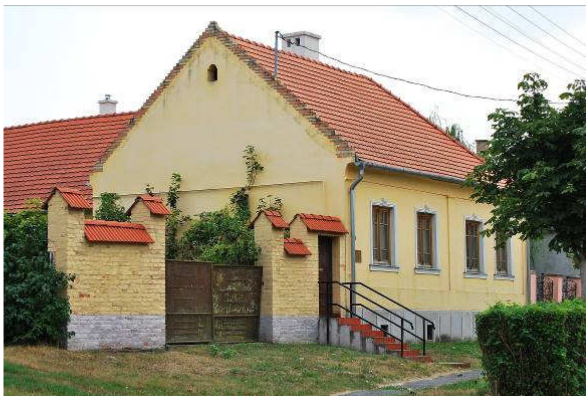
Római katolikus plébánia napjainkban