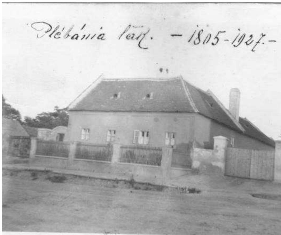
Római katolikus plébánia 1927-ben