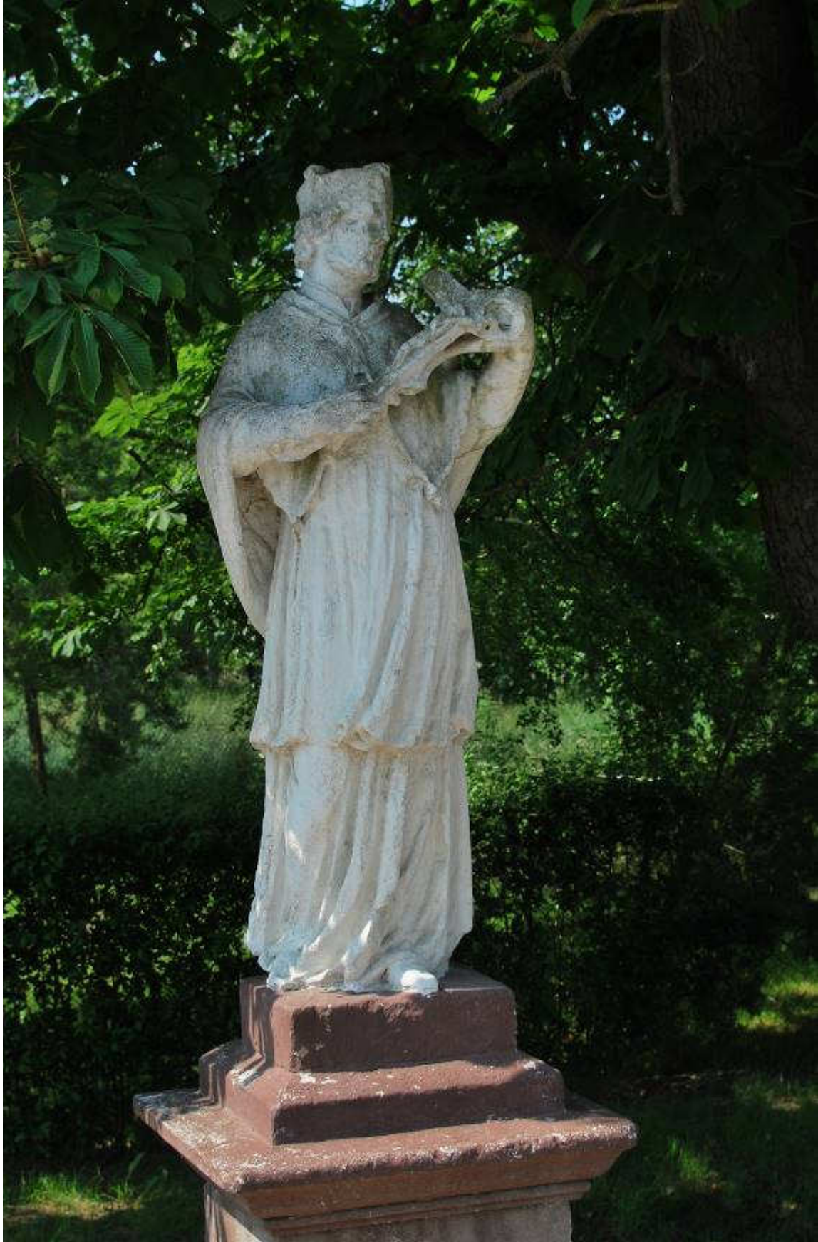
Nepomuki Szent János szobor Lovászpatonán, a Bakony-ér partján