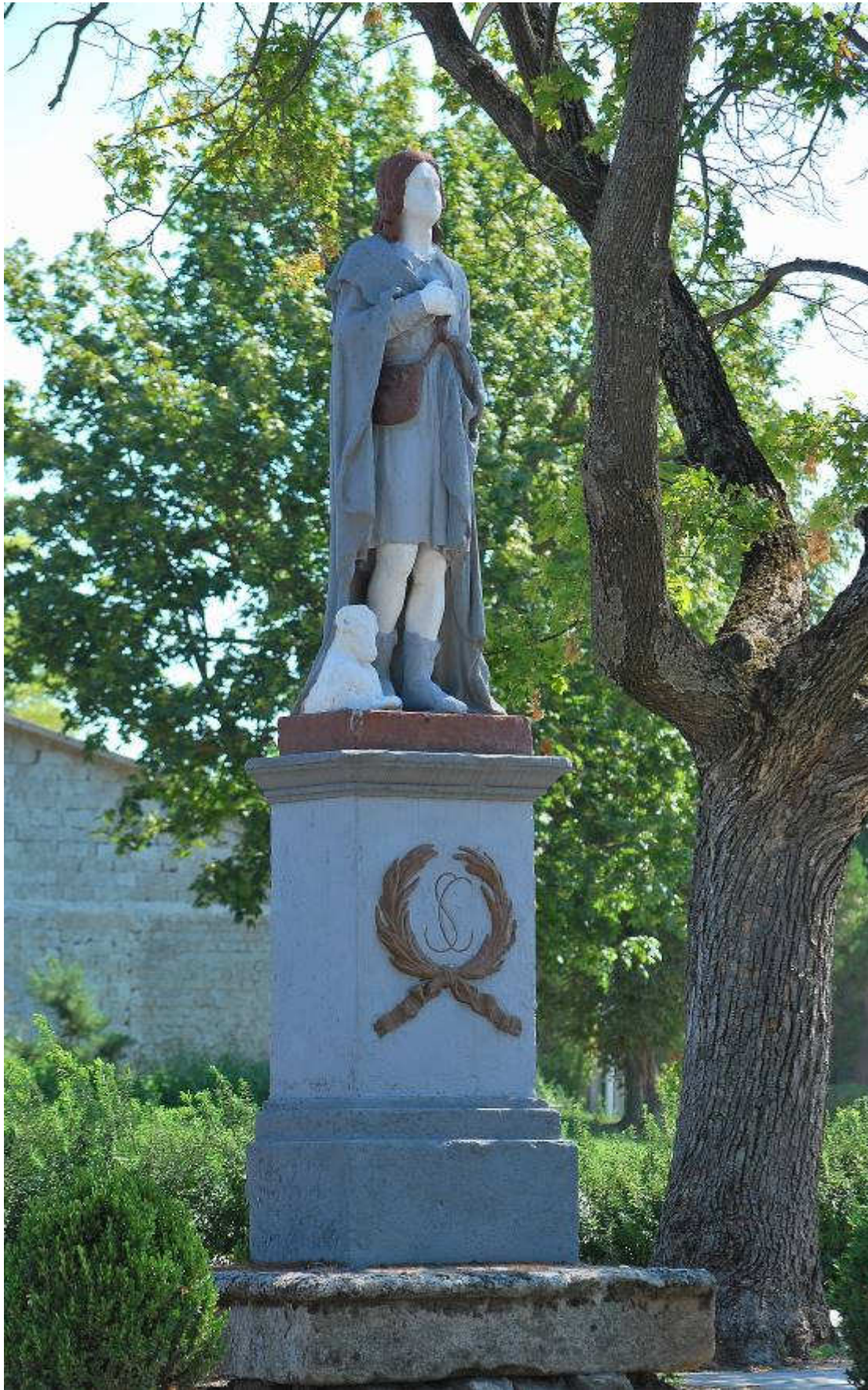
Szent Vendel szobor Lovászpatonán, a Kossuth téren