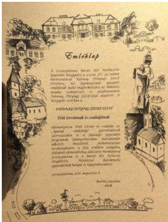
Patonay (Pitying) József –díj Emléklapja