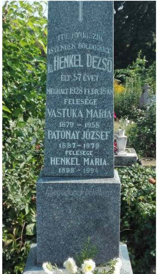
Emlékoszlop a tatai temetőben